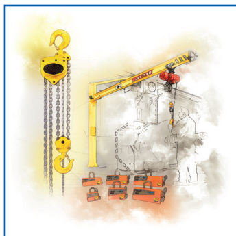
Poprawa bezpieczeństwa przenoszenia ładunków**