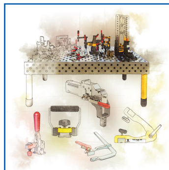
Poprawa ergonomii i bezpieczeństwa pracy***